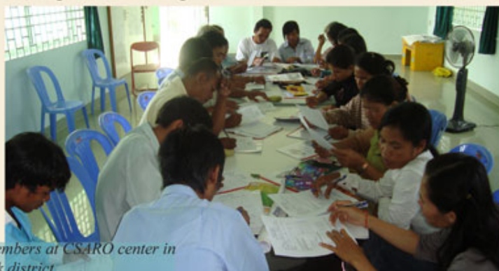
Training provided to CDC members at CSARO center in Khmourch commune, Sen Sok district.

The road took 3 months to be finished – from June to August 2010, and represents a significant achievement in building a community with self-motivation, participation, and clean environment. It is estimated that at least 131 families dwelling in Sen Sok 2 commune will be the direct beneficiaries of this project as they make use of the newly-constructed road. It means children can use the roads when they go to school, adults can more easily go to work or to sell things at the market, and there is less opportunity for disease to spread. By some simple facilitation of initial ideas and action, as well as encouraging commitment, solidarity and hard work from the community, CSARO has enabled the community to achieve this small but very significant change.