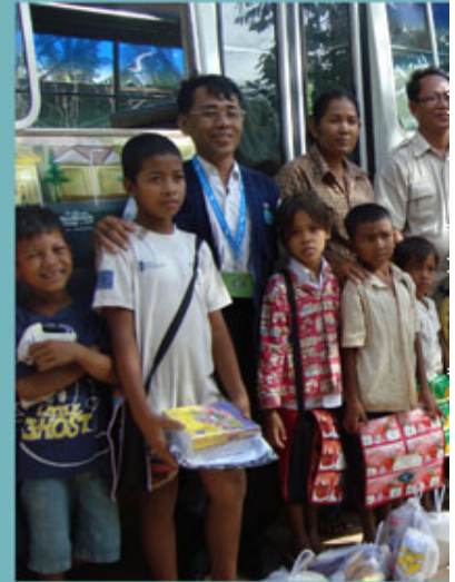
CSARO staff distributed supporting child waste