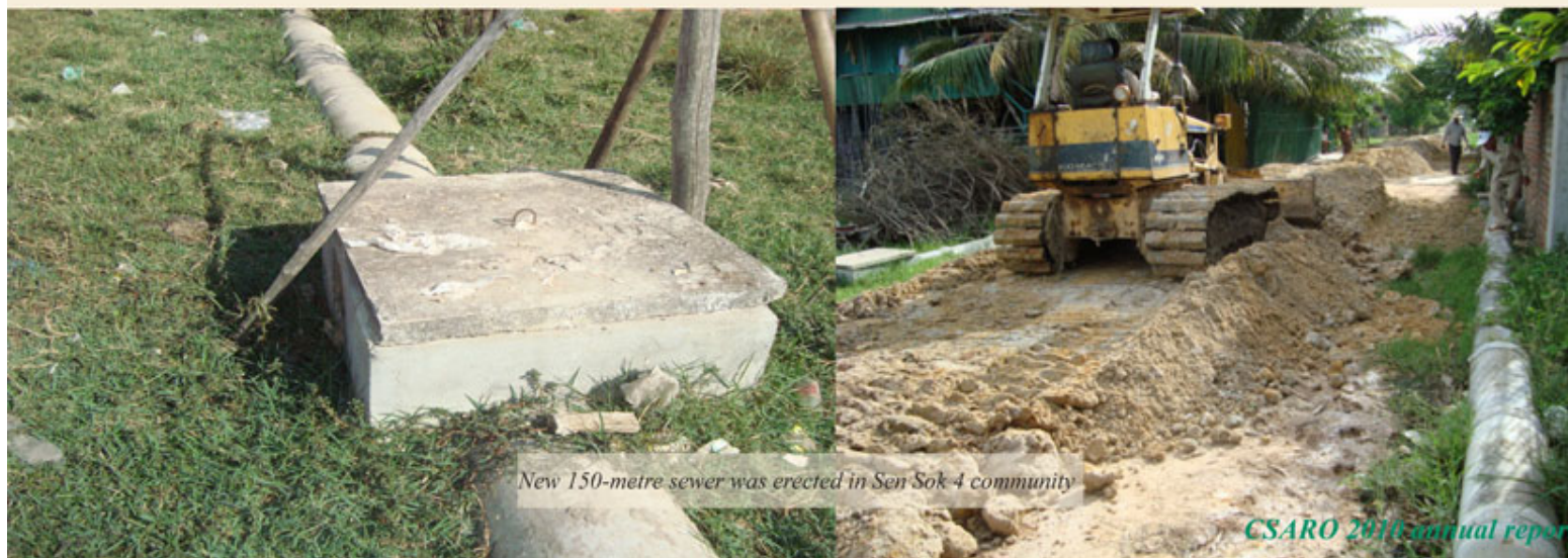
New 150-metre sewer was erected in Sen Sok 4 community

Either mentally or physically or both, most community people and the authorities now start to work together.