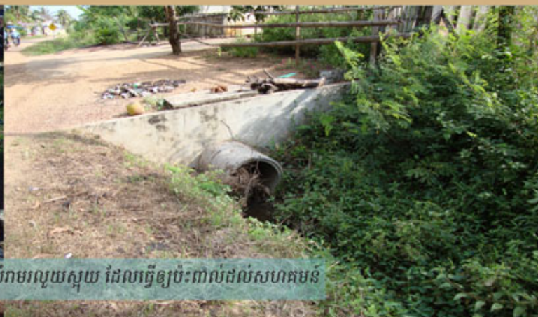
លូបង្ហូរទឹកស្អុយចាស់ស្ទុះដោយសារសំរាមរលួយស្អុយ ដែលធ្វើឲ្យប៉ះពាល់ដល់សហគមន៍

បន្ទាប់ពីបានទទួលនូវការបណ្តុះបណ្តាលជំនាញ និងការផ្សព្វផ្សាយចំណេះដឹងលើការងារអភិវឌ្ឍន៍សហគមន៍ ប្រជាពលរដ្ឋក៏ចាប់ផ្តើមកំណត់នូវបញ្ហាប្រឈមជាអាទិភាពក្នុងតំបន់រស់នៅរបស់ខ្លួន ហើយក៏ស្វែងរកដំណោះស្រាយដែលមានសក្តានុពល ។ ពួកគាត់ក៏បានកំណត់នូវទំហំសកម្មភាពដែលពួកគាត់អាចធ្វើបាន និងសកម្មភាពដែលពួកគាត់ត្រូវការជំនួយ និងការគាំទ្រពីអង្គការក្នុងតំបន់ ឬស្ថាប័នសង្គមស៊ីវិលផ្សេង ៗ ។