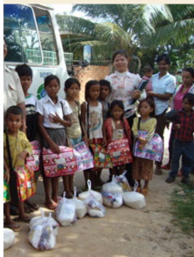
aid such as rice and foodstuffs to the pickers.